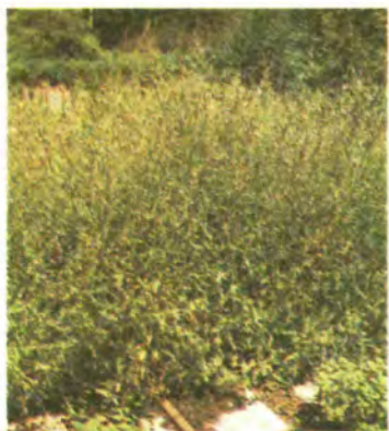
1078. Вербена лікарська.